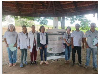
Figura 2: PSF Rosas e Maranhão.