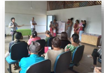
Figura 3: PSF Tomba e Faria.