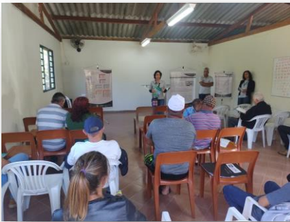
Figura 1: PSF Itirapuan.

Construção de uma ação em conjunto com a Vigilância Ambiental (VA) e Atenção Primária à Saúde nos 17 pontos fixos do PSF Rural. A equipe realizou seis ações educativas neste quadrimestre (figuras 1 a 3). A ação teve como público alvo populações expostas aos agrotóxicos de acordo com a RES n° 8263/2023, mesmo não sendo Lavras um dos municípios prioritários para o indicador PEA (art. 6º da presente RES). Englobou a distribuição da Cartilha sobre Agrotóxicos – Série Trilhas no Campo e bate papo com a comunidade sobre o tema, além do levantamento do sistema de abastecimento individual da água para consumo humano realizado pela VA. E no final da ação foi servido um lanche para os presentes.